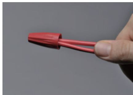
2 x 14 AWG