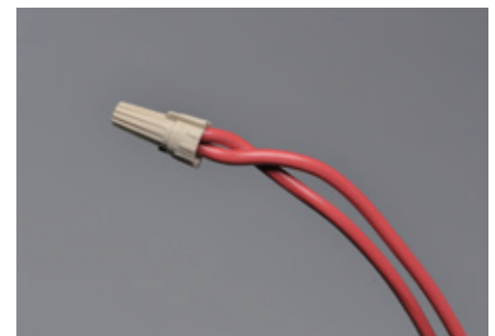
2 x 14 AWG