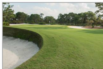
亚利桑那州钱德勒市 太阳鸟高尔夫俱乐部

“更少的部件数量和简单的连接,更易于安装。真的非常易懂 - 我无法想象它还能简化到什么程度。”