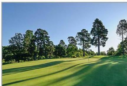
科罗拉多州奥罗拉 奥罗拉山高尔夫俱乐部

“IC系统比解码器快一步,比分控箱系统快好几步。灌溉系统的诊断功能和简单性是我下一步要考虑的。”