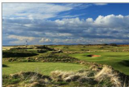
佛罗里达州马瑞克市 殖民地西部乡村俱乐部

“我认为没有其他产品可以与之相比的了。这个系统还有发展的空间。所有我们要做的改变就是利用电线和添加新喷头。”