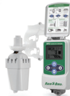
WR2-RFC 无线雨量/ 冻结传感器

ESP-LXD支持多达4个的天气传感器，一个接线到ESPLXD-M50基本模块上，并且多达三个外的可以双线程方式与SD-210传感器解码器相交互。支持包括RSD有线雨量传感器、WR2-RC无线雨量传感器、WR2-RFC无线雨量/冻结传感器以及风力计风速传感器（雨鸟3002脉冲发射器需要用于风力计）在内的雨鸟传感器。土壤湿度传感器所提供的的一个常闭开关界面也同样支持。