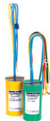
SD210TURF 传感器 解码器